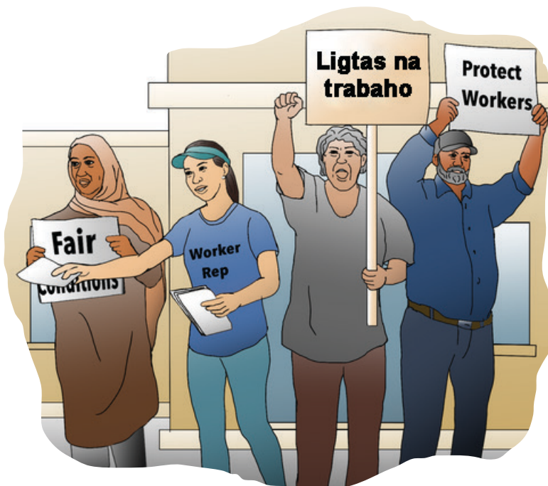
Dagdagan ang pananaw at bumuo ng suporta ng komunidad.