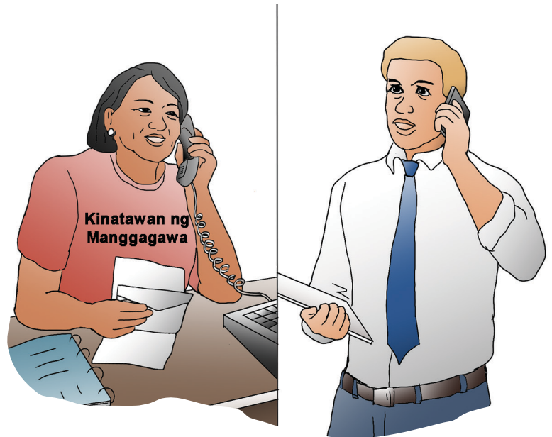
Makipag-ugnayan sa employer sa ngalan ng mga manggagawa.