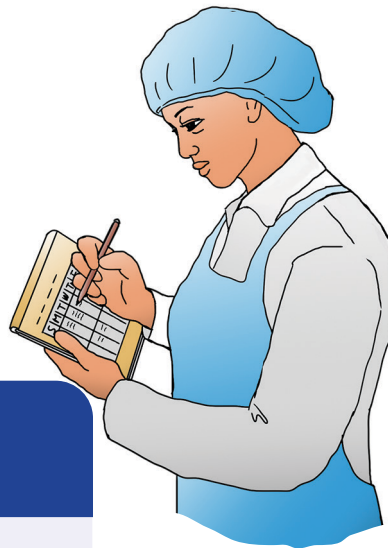
Panatilihin maayos ang mga rekord.