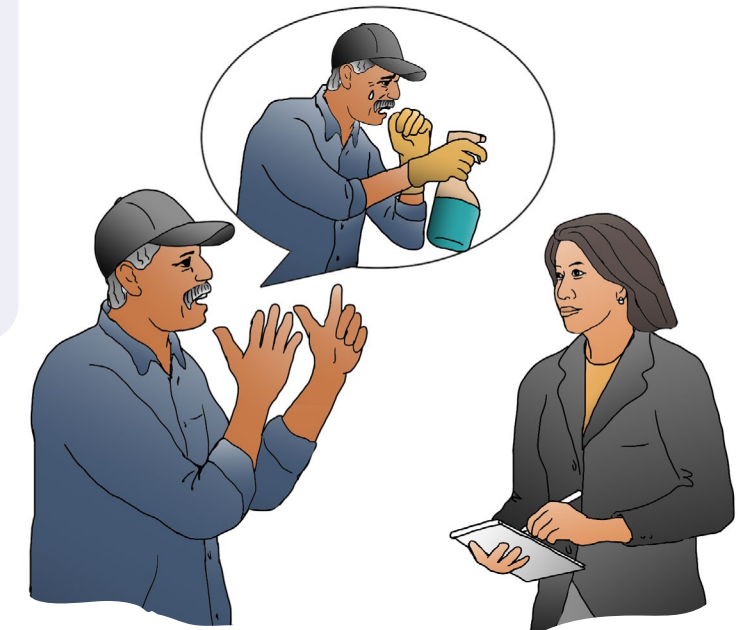
Comparta sus inquietudes con su empleadora y pídale que haga cambios.