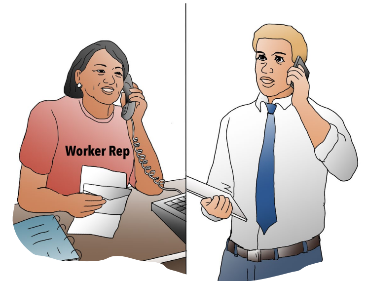
Comuníquese con el empleador de parte del trabajador.