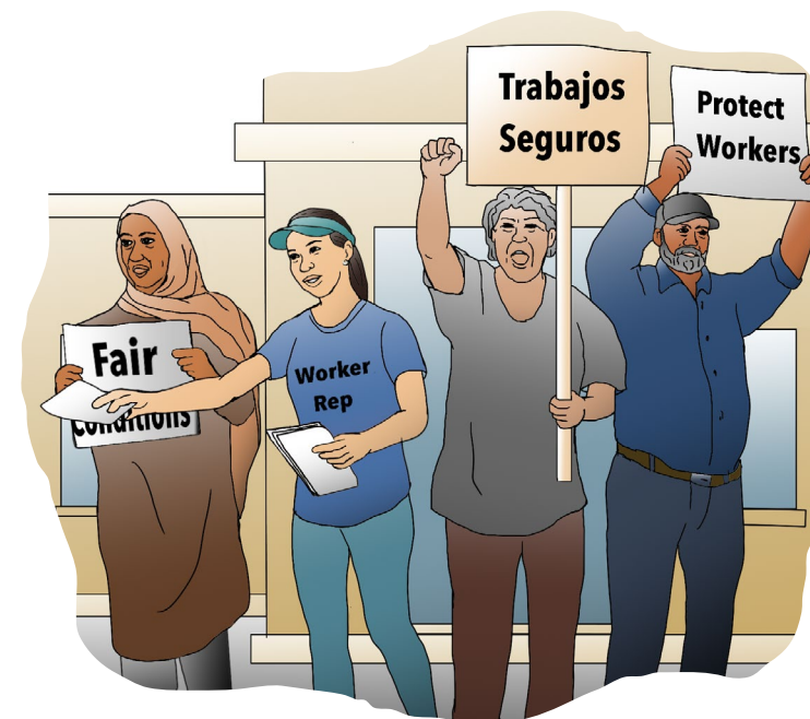
Haga más visible el caso y consiga apoyo de la comunidad.