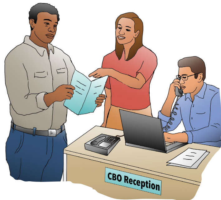
Consiga información y ayuda de una organización en la que confía.