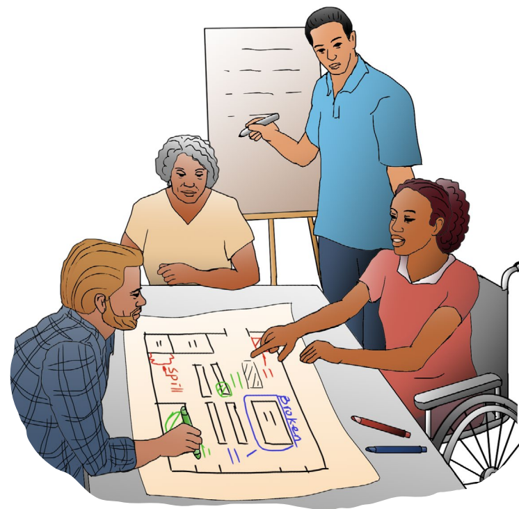
Pregunte a los trabajadores qué peligros están enfrentando.