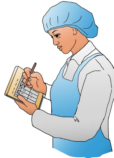
Tome buenos apuntes.