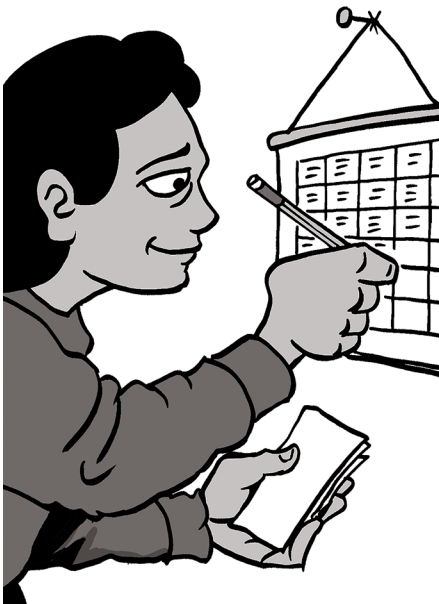
Lleve un record de sus horas de trabajo.

Una copia de la Orden sobre el Salario estatal de su oficio o industria se debe colocar en un lugar donde los empleados puedan verla y leerla fácilmente, como en una sala de descanso.