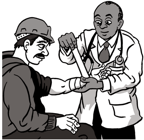
부상을 당한 경우 치료를 받을 권리가 있습니다.